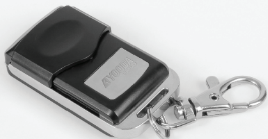
Pilot brelok SKIDA YSH 1-kanalowy, czarny (SKIDA_1Rk YSH)